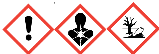
GHS07 - GHS08 - GHS09

Etiquetado : Componentes determinantes del peligro para el etiquetado : Sulfato de níquel